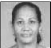
വൽസമ്മ സ്കറിയ ചങ്ങനാശ്ശേരി അതിരൂപത