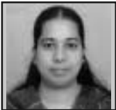
ഷെർമി കാർമു കോട്ടപ്പുറം രൂപത