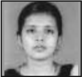
ഡിൻ്റ ബേബി കോതമംഗലം രൂപത