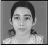
അൽന റോസ്മി സേവി ചങ്ങനാശ്ശേരി അതിരൂപത