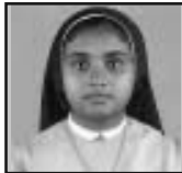
സി. ബെറ്റി എൽ. എ. ആർ പാലാ രൂപത