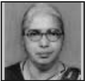
ഫിലിക്കുട്ടി തോമസ് കോതമംഗലം രൂപത