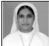
സി. എയ്ഞ്ചൽ റോസ് എസ്. എ. ബി. എസ് പാലാ രൂപത