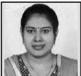
അമ്പിളി ലിയോ തൃശ്ശൂർ അതിരൂപത