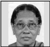
ജാനറ്റ് ഐ. സി. തിരുവനന്തപുരം (ലാറ്റിൻ) അതിരൂപത